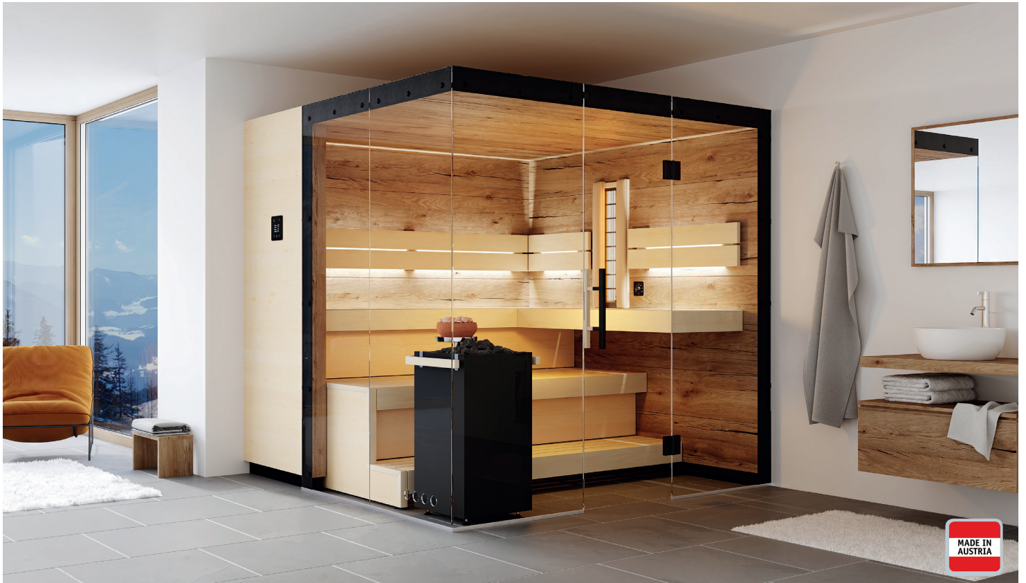
Abbildung Bergzauber mit Sonderausstattung: Schwebeliege, Fußauftritt, Saunabock 2-stufig, LED-Rückenlehnenbeleuchtung, VITALight-IPX4-Infrarotstrahler mit Rückenpolster, Verdampferofen mit Sole-Therme Pur, Steuerung Saunacontrol T4. Holzart innen und außen: große Saunapaneele in Eiche rustikal, außen: Saunapaneele in Ahorn.

71 - 77 mm starke vorgefertigte Elemente in horizontaler Bauweise