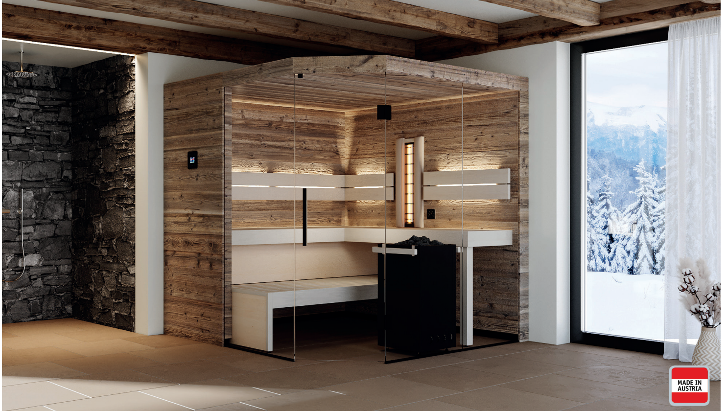
Abbildung Bergzauber mit Sonderausstattung: LED-Rückenlehnenbeleuchtung, VITALlight-IPX4-Infrarotstrahler mit Rückenpolster, Steuerung Saunacontrol T4, Verdampferofen. Holzart innen und außen: große Saunapaneele in Altholz Fichte sonnenverbrannt.