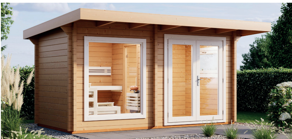
Abb.: Gartensauna BELLA 3A mit großem Saunafenster und Eingangstür in exklusiver Ausführung

GROSSES SAUNAFENSTER (BxH: 1440 x 799 mm)