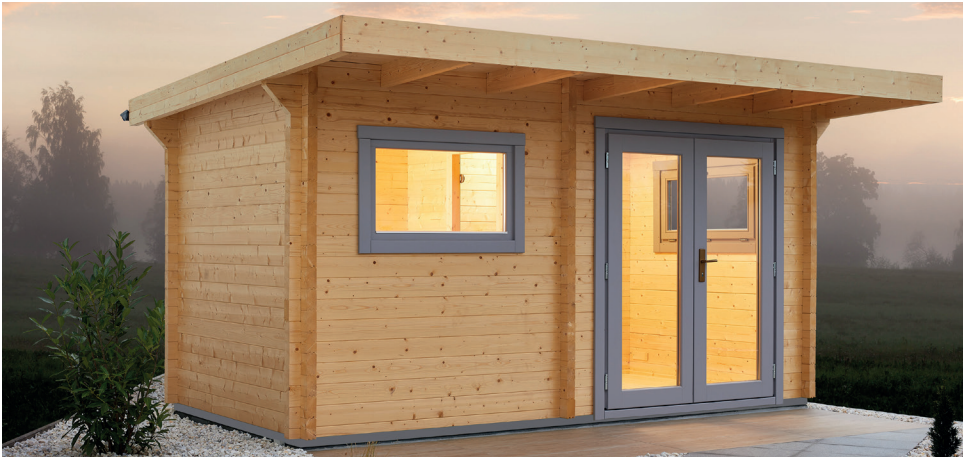
Abb.: Gartensauna BELLA 3 mit Fenster und Eingangstür in exklusiver Ausführung